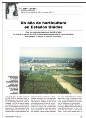
Revista Horticultura, 1992.